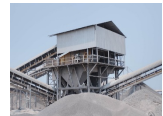
โรงโม่หินของโครงการ