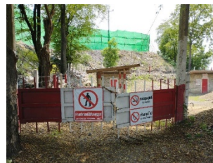
อาคารเก็บวัตถุระเบิด