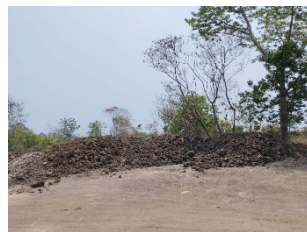
พื้นที่กองเปลือกดิน