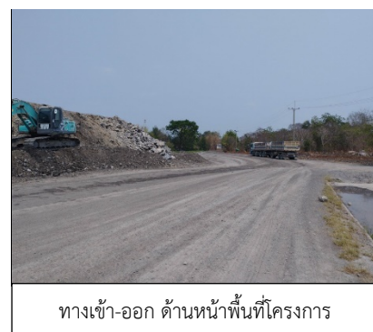
ทางเข้า-ออก ด้านหน้าพื้นที่โครงการ