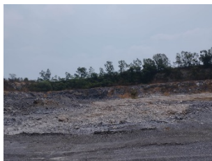
พื้นที่หน้าเหมืองของโครงการ