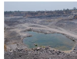
บ่อขุมเหมือง/บ่อดักตะกอน